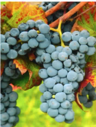
VB: Cal. 1-28 (S)