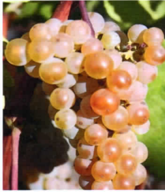
Sauvignon Soyhères (VB: 31-07) (S)