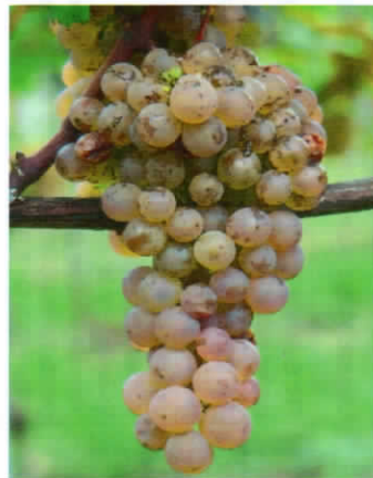
Sauvignac (VB: Cal. 6-04) (S)