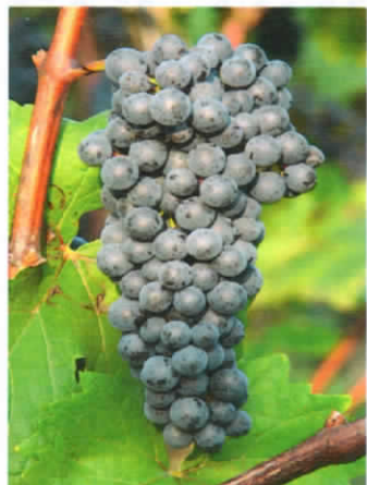
Cabernet Jura (S)