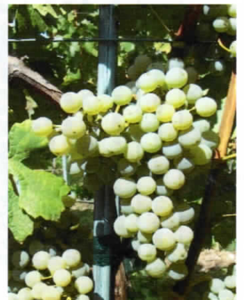
Cabernet Blanc (S)